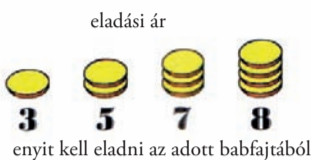
enyit kell eladni az adott babfajtából