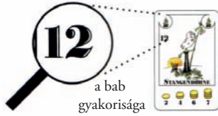
a bab gyakorisága