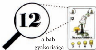
a bab gyakorisága