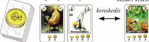
kártya az egyik játékos kezében

Uwe egy karósbabot és egy viaszbabot csapott fel. A viaszbabot megtartja, a karósbabot pedig, mivel nem illik a földjein termelt babok közé, felajánlja a többieknek. Azt kérdezi: "Szeretne valaki egy karósbabot? Legszívesebben egy vörösbabért adnám oda."